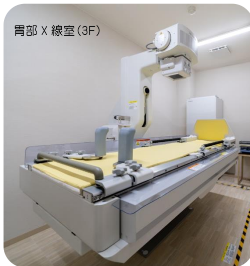
胃部 X 線室(3F)