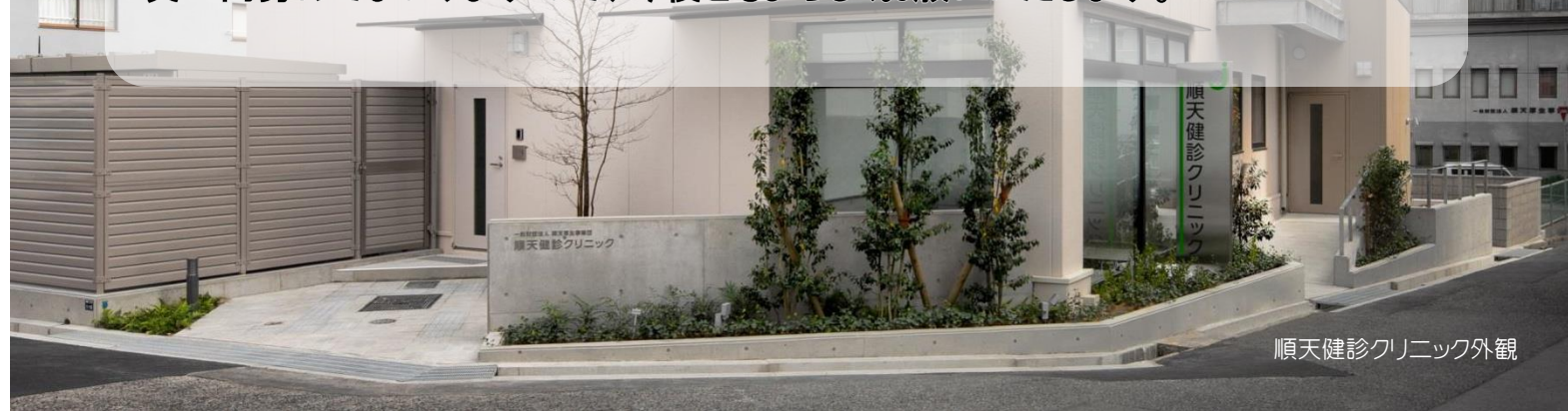
順天健診クリニック外観

それに伴い、長年ご愛顧いただいた診療部門を終了し、健康診断部門のみの営業となりました。ご不便をおかけいたしますが、スムーズな健康診断ができるように職員一同努めてまいりますので、今後ともよろしくお願いたします。